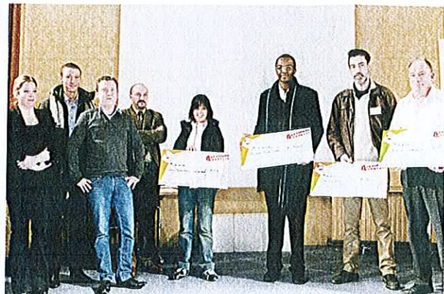
Les lauréats, lors de la remise des prix qui a eu lieu le 24 janvier dernier, à la Maison de l'Éducation permanente, à Lille.

Par ailleurs, Ateliers sans frontières a lancé dans le Nord-Pas-de-Calais le programme Assoclic, dont c'était la 2 e édition en 2011. Suite à un appel à projets, 54 associations de la région ont été dotées l'année dernière de 410 ordinateurs fournis par Ateliers sans frontières pour leur permettre, grâce à l'accès à l'outil informatique, de mener à bien une action d'insertion, d'éducation, de santé ou d'intégration sociale, contribuant ainsi à